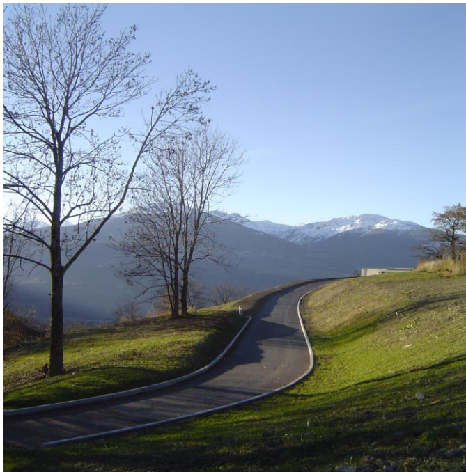
Quartier de Voirambeys - Mollens 2012