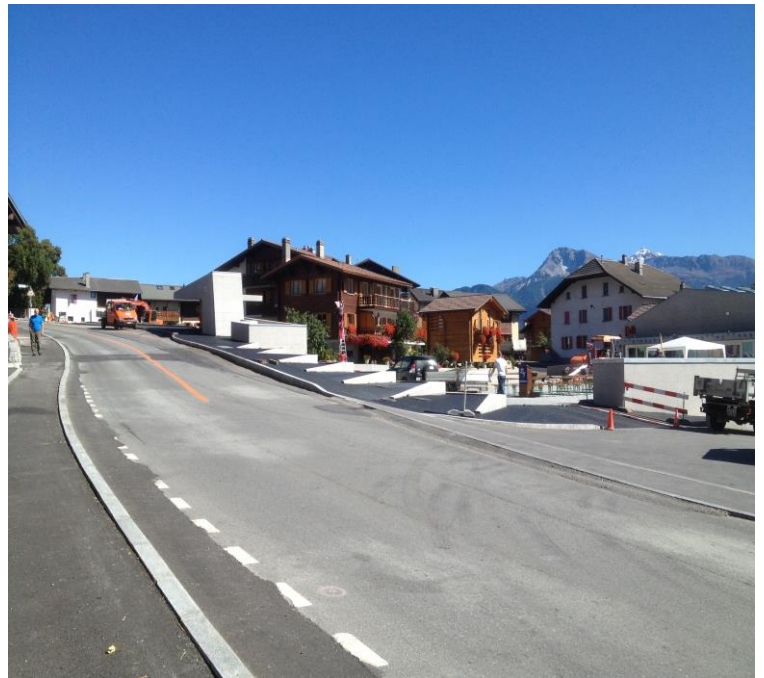
Quartier ALRV - Aminona - routes de desserte – 2016-2018